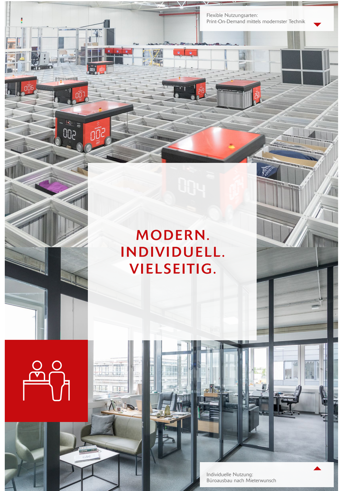
Flexible Nutzungsarten: Print-On-Demand mittels modernster Technik