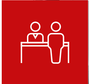
Individuelle Nutzung: Büroausbau nach Mieterwunsch